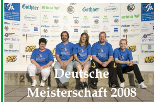
Deutsche Meisterschaft 2008

Die trainierten Eigenschaften wie Konzentration oder mentale Ausgeglichenheit helfen nicht nur beim Sport weiter, sondern unterstützen auch im Alltag.