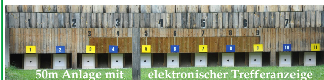
50m Anlage mit elektronischer Trefferanzeige