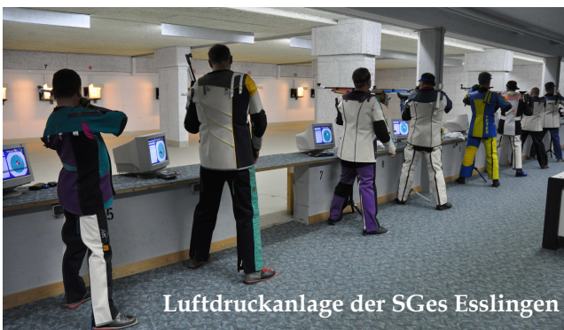
Luftdruckanlage der SGes Esslingen

Neugier geweckt? Wollen Sie nun selbst erleben, was Sportschießen wirklich ist und was genau dahinter steht? Nichts einfacher als das!